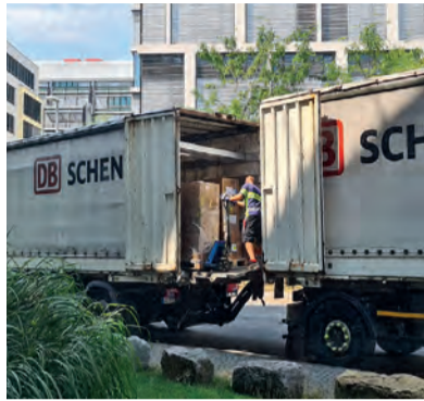
Zwei Millionen Masken hat die Diakonie in Württemberg von den Firmen BASF und Sagrotan gespendet bekommen.

Die Diakonie während der Corona-Pandemie