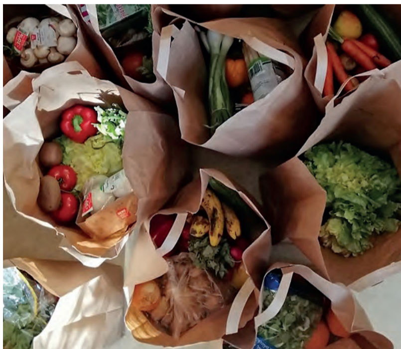
Tüten aus dem Lebensmittellager für Bedürftige in Crailsheim.

Wichtig für die Außenwirkung ist auch die Weihnachtsbaumaktion des Diakonieverbandes. Auch mit ihr soll um Verständnis für die Menschen geworben werden, die am dünnen Ende der Einkommenskette sitzen. Gabriele Hopfinger muss da an die vielen „Kleinrentner“ denken, die ihr Leben lang gearbeitet haben und denen es jetzt doch nicht reicht. Allerdings: Diese Menschen haben oft eine hohe Schamgrenze. Sie scheuen den Weg zum Amt und wollen keine Bittsteller sein. „Ich erkläre ihnen dann, dass sie keine Almosen erhalten. Sie erhalten die Hilfe, die ihnen zusteht. Das versuche ich zu vermitteln.“